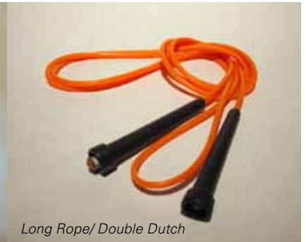
Long Rope/ Double Dutch

Seilspringen ist out – „Rope Skipping“ ist in! Das gleiche Sportgerät und doch eine andere Sportart, die mehr Begeisterung auslöst?