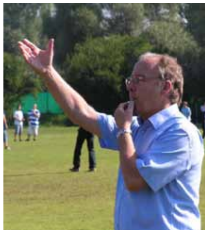
Auch der Schulleiter half tatkräftig mit

Der Spiel- und Sporttag war insgesamt ein voller Erfolg, der Schülerinnen und Schüler durch sein vielfältiges Angebot begeisterte. Der reibungslose Ablauf und die positiven Rückmeldungen von